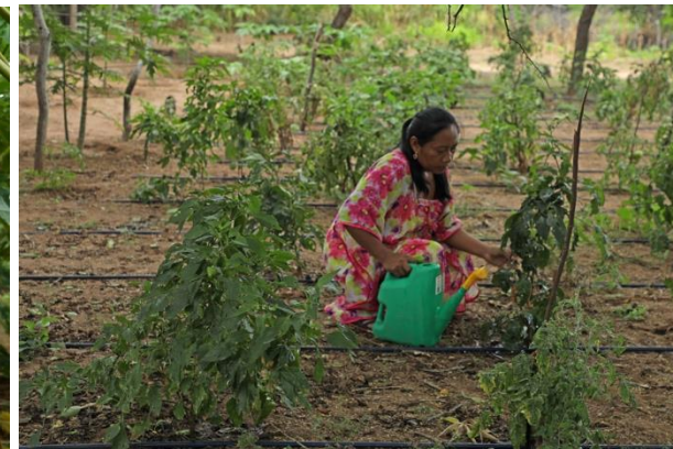
Interés en escalar y replicar modelo de trabajo con comunidades en La Guajira