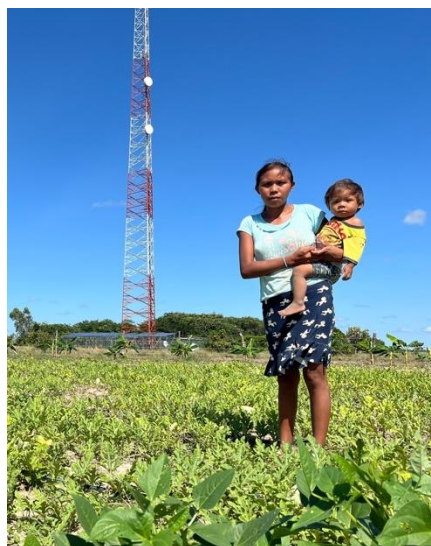
Desarrollar un esquema de proveeduría inclusiva con comunidades indígenas y Kardianuts SAS