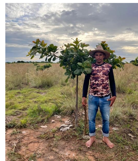
Potencial de trabajo con comunidades del resguardo de Kanalitojo